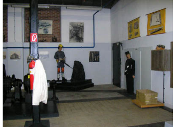
Bilder: Innenansicht des Museums Auguste Victoria Schacht 4

Die Zeche Ewald in Herten befindet sich ebenfalls in der Umbauphase. Nach der Stilllegung der Zeche wird hier ein Industriestandort für Unternehmen verschiedenster Größenordnung entstehen. Historische und unter Denkmalschutz stehende Zechengebäude sollen erhalten bleiben und einer neuen Nutzung zugeführt werden. Im Malakowturm aus dem Jahre 1888 entsteht ein Bürogebäude, ein Hotel mit Einkaufsmöglichkeiten ist in der Planung und kurz vor der Eröffnung steht ein Restaurant, der Zechenbaron.