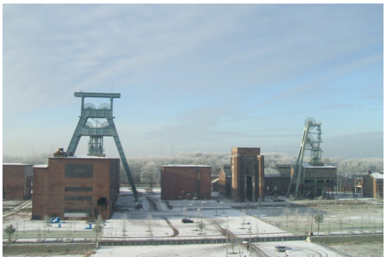
Blick von der Halde Hoppenbruch auf das Gelände der Zeche Ewald

In der alten Heizzentrale aus dem Jahre 1916 entstand eine Eventhalle, in der bereits jetzt diverse Veranstaltungen laufen. 2 große Halden mit phantastischer Sicht über das gesamte Ruhrgebiet und begrünte Wanderwege hinter dem Zechengelände laden zu ausgiebigen Spaziergängen ein. Unter Aufrechterhaltung der historischen Bausubstanz wird hier ein unvergleichbares Ensemble entstehen, das Tradition mit moderner Architektur vereint.